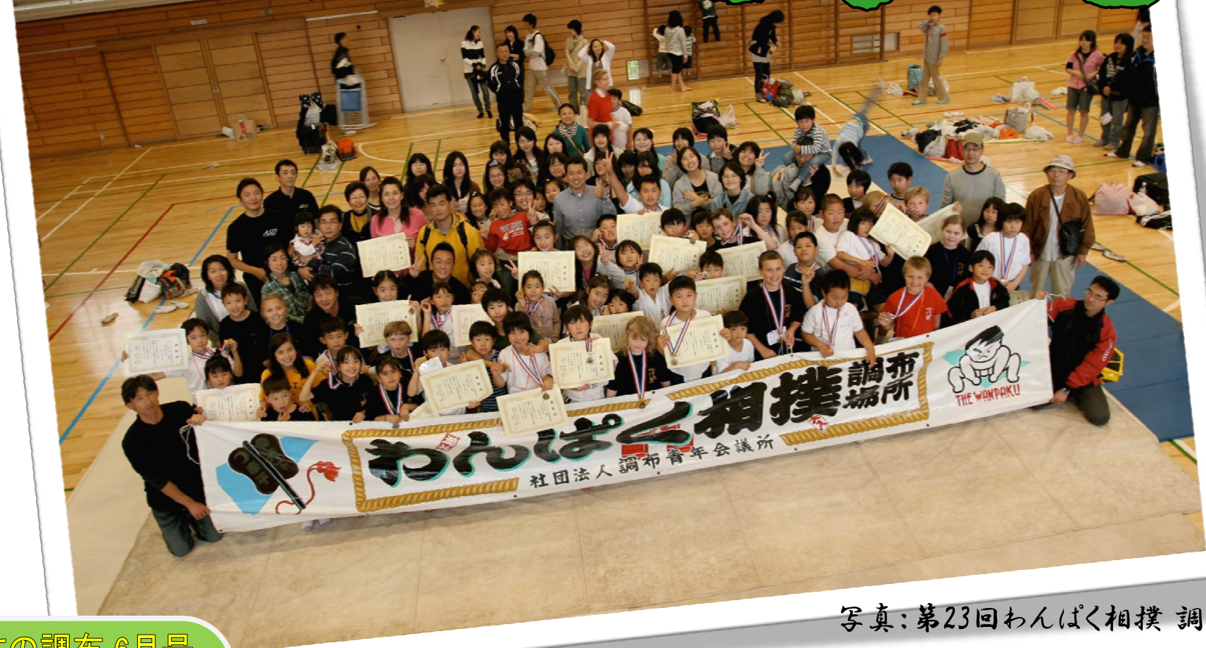
写真:第23回わんぱく相撲 調布場所